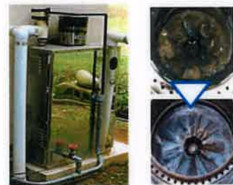
ボイラー燃焼部のカーボンもキレイに