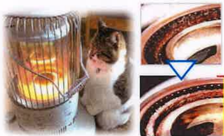
ストーブのガラス芯のカーボンも取れる