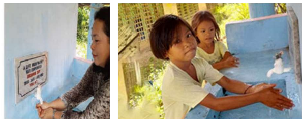
ソルソゴン州マトノック町ツガス村 ツガス小学校へ簡易水道システムを寄贈